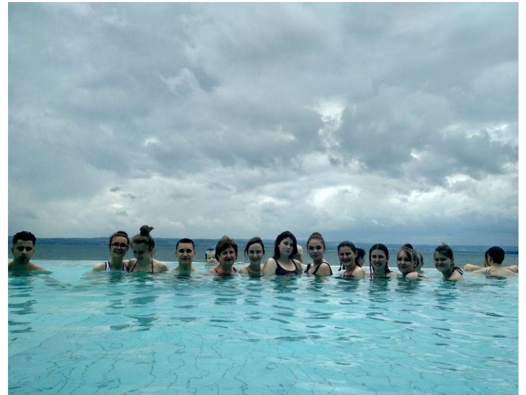
Gegenbesuch in Ravensburg 2019