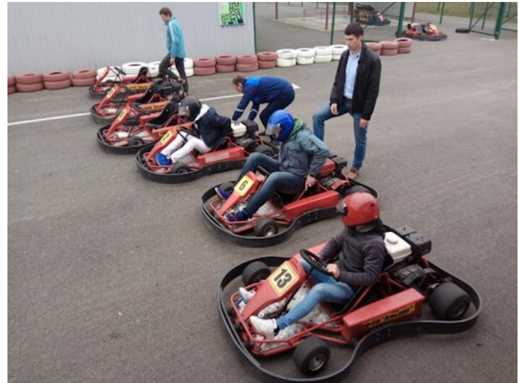
Besuch in Brest 2018